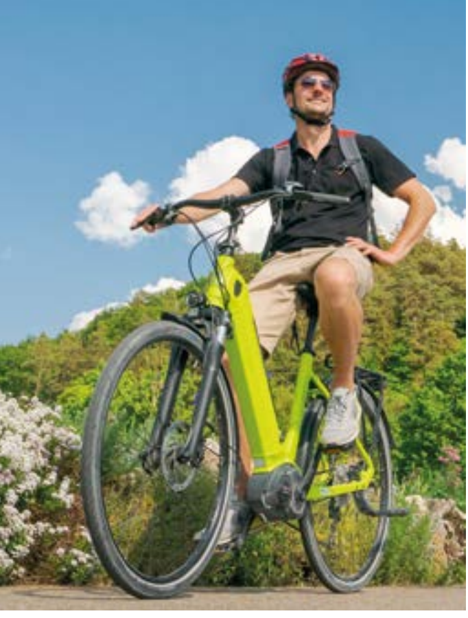
Info-Hotline: 0800/733532 • www.stromtreter.de