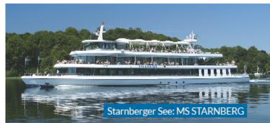
Starnberger See: MS STARNBERG

*Beschränkte Beförderungskapazität. Bitte auf Verlangen die gültige bayerische Ehrenamtskarte sowie einen Ausweis als Identitätsnachweis vorlegen.