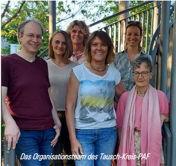
Das Organisationsteam des Tausch-Kreis-PAF