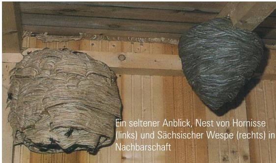
Ein seltener Anblick, Nest von Hornisse (links) und Sächsischer Wespe (rechts) in Nachbarschaft

Die Königin beginnt im Frühjahr mit drei Zellen und einer Hülle aus verwittertem oder morschem Holz. Wenn nach ca. 6 bis 8 Wochen die ersten Arbeiterinnen schlüpfen, übernehmen diese die Fütterung der Brut und die Königin bleibt zum Eierlegen im Nest.