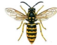
Sächsische Wespe (Dolichovespula)