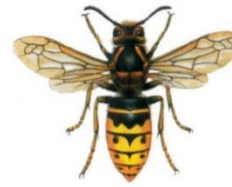
Mittlere Wespe (Dolichovespula)