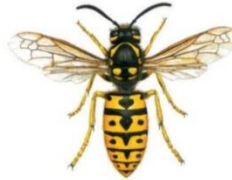
Deutsche Wespe (Paravespula)