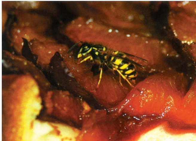
Wenn der Sonntagskuchen auf dem Gartentisch steht, können Deutsche und Gemeine Wespen lästig werden.