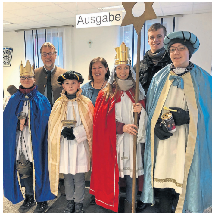
Die Sternsinger in der Landratsamt-Außenstelle Nord in Vohburg.