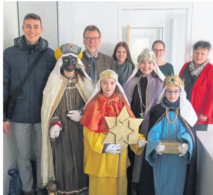
Die Sternsinger im Büro Landrat im Landratsamt Pfaffenhofen.

Die Ministranten alias Kaspar, Melchior und Balthasar überbrachten mit einem Spruch gute Wünsche und bedankten sich bei dem Landrat für die Spende, die Notleidenden Kindern zu Gute kommt.