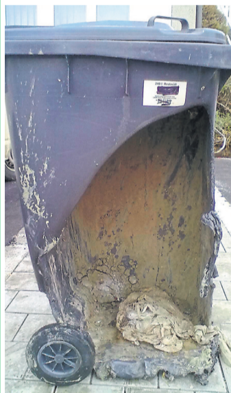
Asche erst dann in die Restabfalltonne geben, wenn diese vollständig erkaltet ist.

Ist eine Abfalltonne beschädigt, sollte man sich am besten direkt mit dem AWP unter Tel. 08441 7879-50 in Verbindung setzen. Dort wird der Schaden aufgenommen und umgehend eine Ersatztonne geliefert bzw. zur persönlichen Abholung bereitgestellt. Die Kosten für eine Ersatztonne nach einem Tonnenbrand werden in Rechnung gestellt.