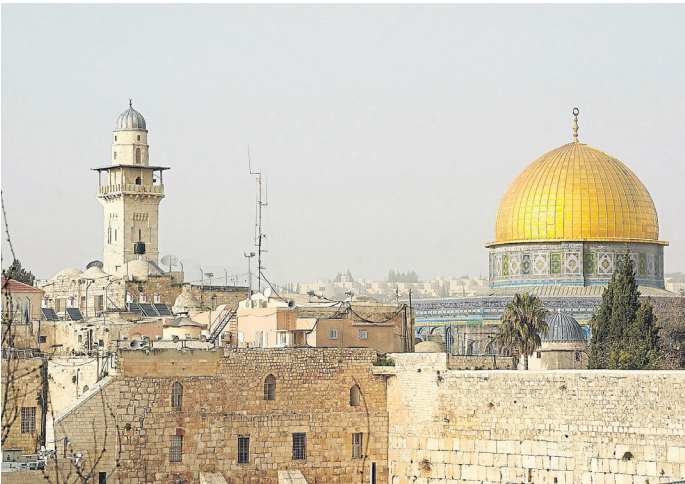
Ein Vortrag der Reihe vhs.wissen.online lautet „Alltag im Ausnahmezustand: Ein Blick auf Israel“.

An diesem Abend sind alle eingeladen gemeinsam einfache Lieder mit kurzen Texten aus aller Welt zu singen. Es braucht keine Vorkenntnisse, willkommen sind alle, die Freude am gemeinsamen Singen haben.