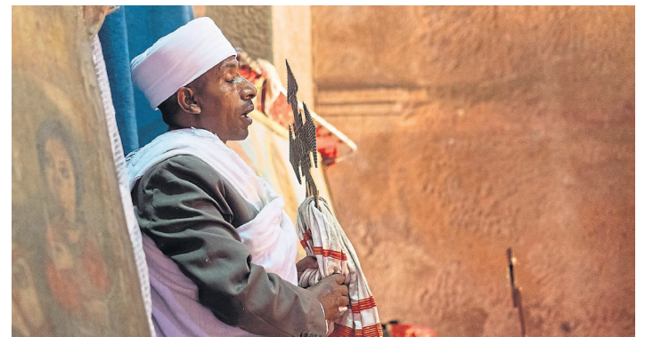
Die diesjährige Studienreise geht nach Äthiopien, einem der ältesten christlich geprägten Länder.

Quellen des Nils und den imposanten Wasserfällen "Tis Issat", nach Gondar, der ehemaligen Kaiserstadt auf 2100 Metern Höhe, weiter über Lalibela mit den beeindruckenden Felsenkirchen, nach Auxum (wo u.a. nach der Überlieferung die Original-Gesetzestafeln Moses liegen) und zurück in die Hauptstadt Addis Abeba. Reiseinformationen können telefonisch unter (08441) 27446 angefordert werden.