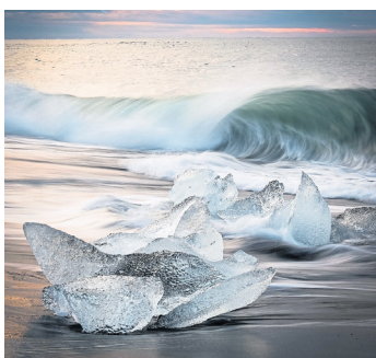
Eines der Bilder, die bei der Ausstellung zum Jubiläum der Fotofreunde der vhs zu sehen ist.

In diesem Jahr feiern die Fotofreunde der vhs Pfaffenhofen ihr sechzigjähriges Bestehen mit einer Ausstellung in der städtischen Galerie und einer Feierstunde am 17. April im großen Sitzungssaal des Landratsamts Pfaffenhofen.