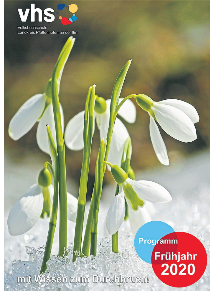
mit Wissen zum Durchbruch!

Neues entdecken kann man bei der Volkshochschule in vielen Bereichen. Aloha! So heißt es in einem neuen Sprachkurs für Hawaiianisch, der im März beginnt. Die Teilnehmer*innen steigen nicht nur in diese leicht zu erlernende und stark auf Selbstlauten basierte Sprache ein, sondern bekommen auch einen Eindruck vom hawaiianischen Lebensgefühl und der geistigen Welt Polynesiens. Neu im Angebot sind wieder Englisch-, Italienisch- und Französischkurse für Anfänger ohne Vorkenntnisse. Neue Fitness- und Gesundheitskurse helfen, den Winterspeck in Angriff zu nehmen und in einem neuen Angebot aus dem Fachbereich Ökologie wird