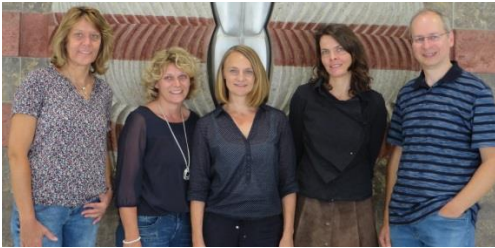
Ein Teil der Geburtshelfer des Tausch-Kreises-PAF